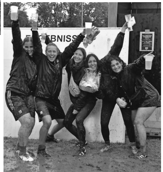
Sieger Damen: 5 Kurze

Spiel um Platz 3 bezwang „Kartoffelsalta“ die Sportfischer Grünkraut“ mit 5:4. Und im Finale hatte die Mannschaft „Der Fiebertraum“ mit 3:2 das bessere Ende für sich und belegte Platz 1 vor dem Team „FC Gichthocke“