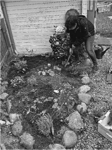
gemeinsam geht es leichter

Vielen Dank an dieser Stelle an die fleißigen Helfer und großzügigen Spender!