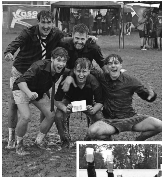
Sieger Herren: Der Fiebertraum

In 16 Gruppen traten die Herren in der Vorrunde an und ermittelten die 64 Mannschaften die sich für die Zwischenrunde qualifizierten. In der Zwischenrunde begann es leider in Strömen zu regnen. So war man gezwungen die KO-Runde abzukürzen und es qualifizierten sich nur die beiden Erstplatzierten jeder Gruppe. Über Achtel- und Viertelfinale qualifizierten sich letztlich 4 Mannschaften für das Halbfinale. Im ersten Halbfinale setzte sich die Mannschaft „Der Fiebertraum“ mit 4:2 gegen die „Sportfischer Grünkraut“ durch. Und der „FC Gichthocke“ setzte sich mit 4:3 gegen die Mannschaft „Kartoffelsalta“ durch. Im