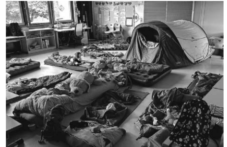
Text und Bild: Ulrike Borlinghaus

Liebe Eltern, Sie waren spitze, vielen Dank für die tolle Unterstützung beim Richten des Buffets, der Schlafplätze und für die Betreuung an den Stationen.